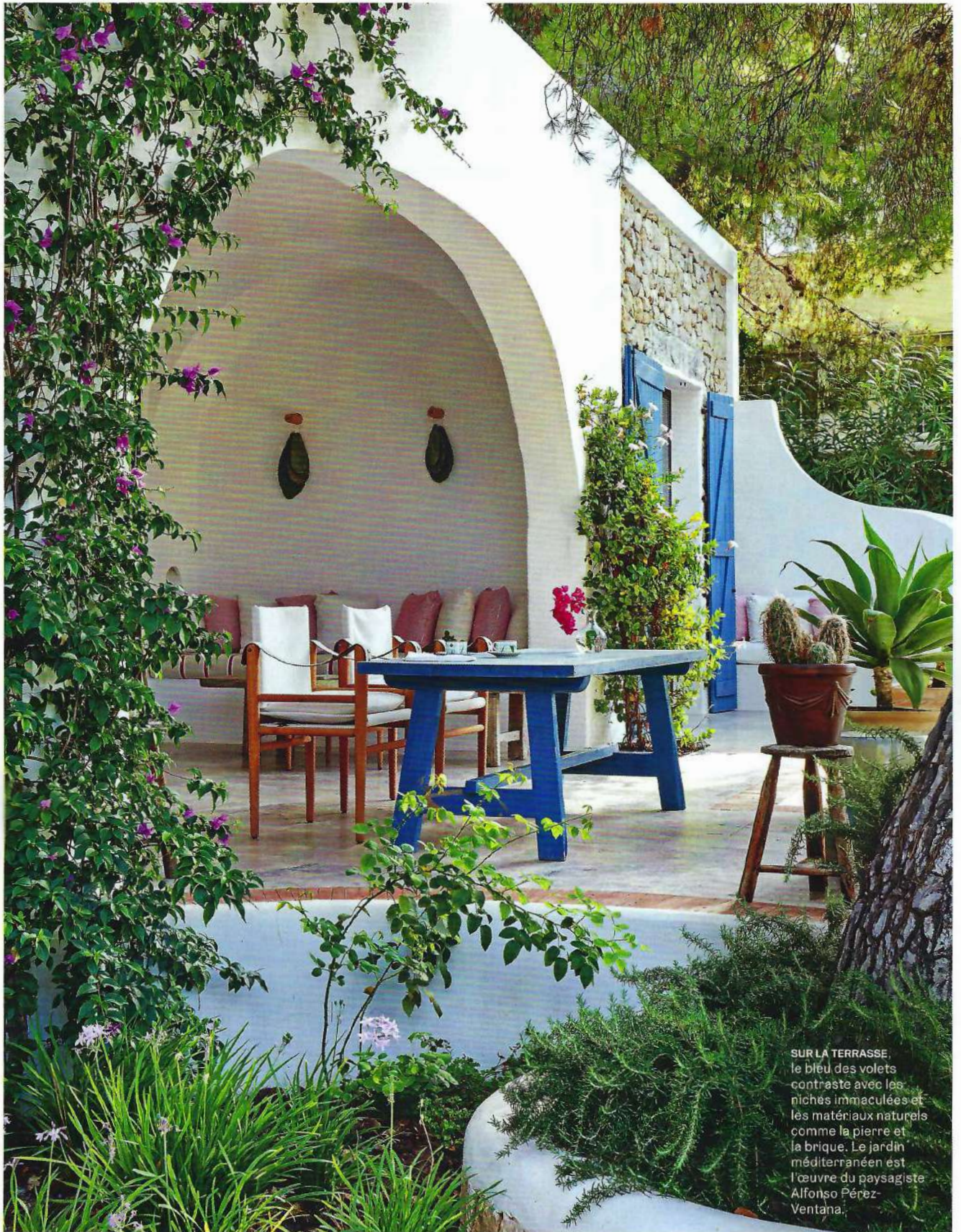
SUR LA TERRASSE, le bleu des volets contraste avec les niches immaculées et les matériaux naturels comme la pierre et la brique. Le jardin méditerranéen est l'œuvre du paysagiste Alfonso Pérez- Ventana.